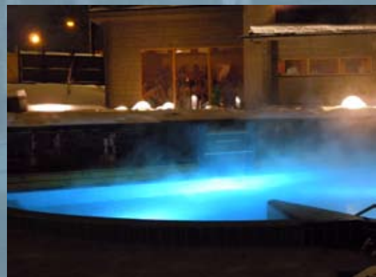
Utedel med varmpool och vedbastu