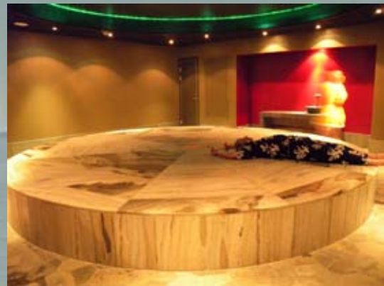
Varm ligghäll i marmor