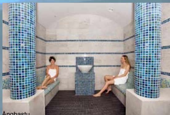
Ångbastu Storsjöbadet, Östersund 2008 Om- och tillbyggnad