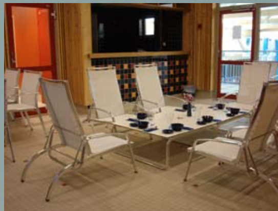
Mariehamn Åland Relaxavdelning, Nybyggnad av badanläggning