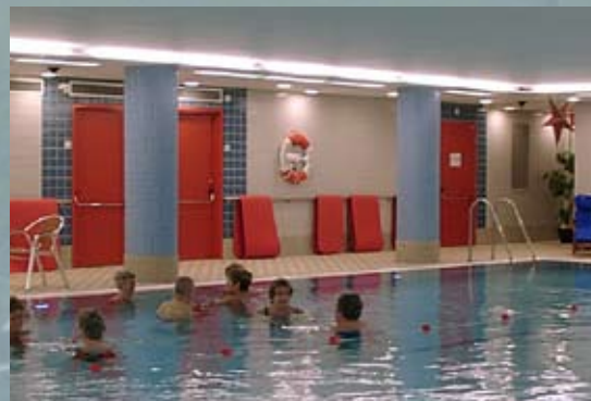
Rehabbassäng Dalheimers hus Ombyggnad av rehab-bad i Göteborg